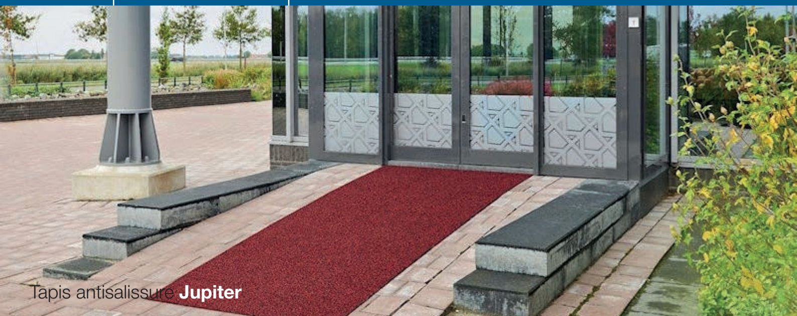
Tapis antisalissure Jupiter