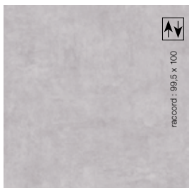
2 m - BTODT902 LRV 38 3 m - BTODT903 4 m - BTODT904