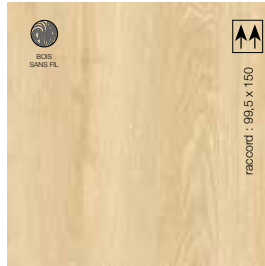
2 m - BTELT322 LRV 35 3 m - BTELT323 4 m - BTELT324