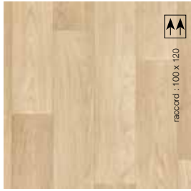
2 m - BTCAT272 LRV 50 3 m - BTCAT273 4 m - BTCAT274