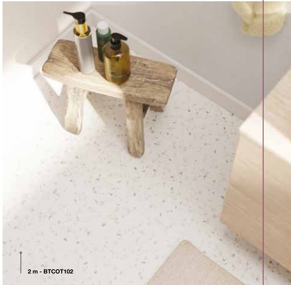
2 m - BTCOT102