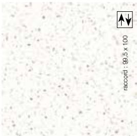
2 m - BTCOT102 LRV 74