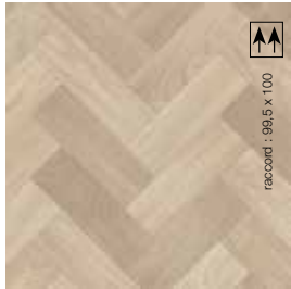
2 m - BTSIT452 LRV 42