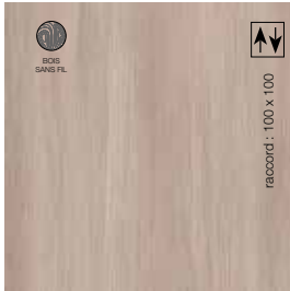
2 m - BTSC812 LRV 31