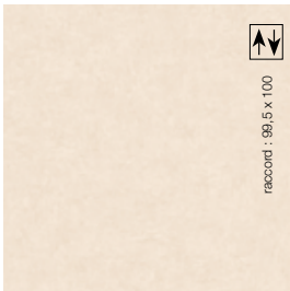
2 m - BTODT362 LRV 61