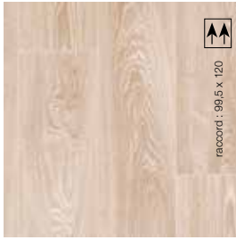
2 m - BTALT322 LRV 40